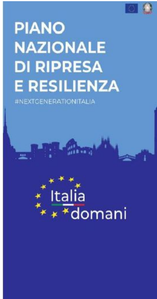
PNRR - M5C2 - presentazione piano operativo