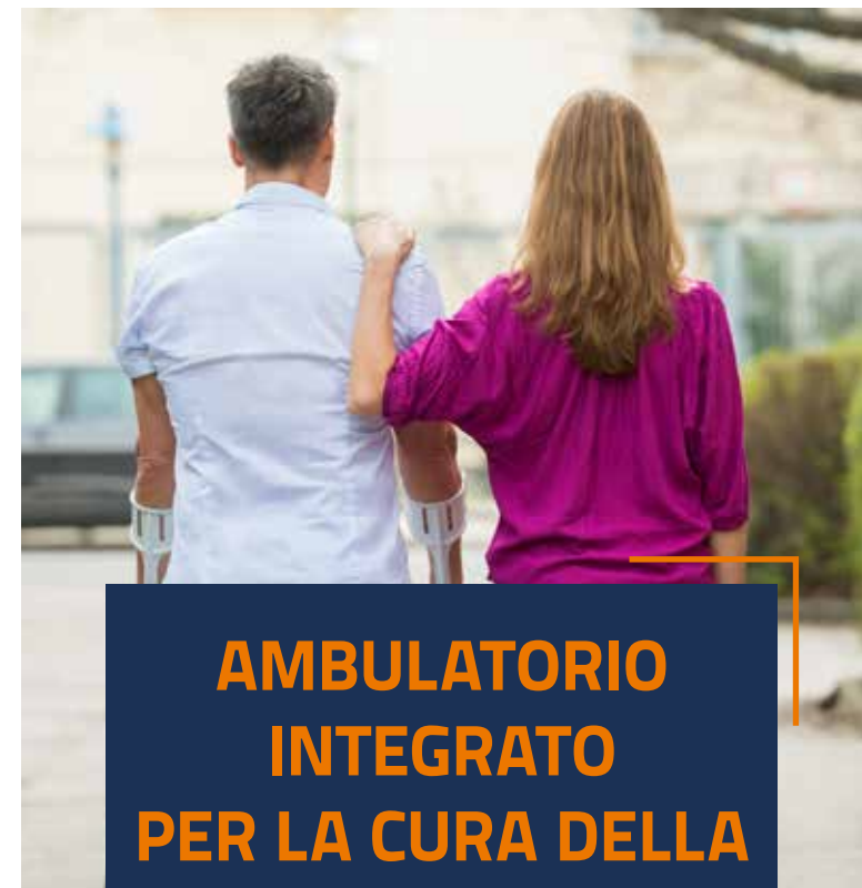
Grafica e impaginazione URP - Comunicazione e Marketing - 10.20

AMBULATORIO INTEGRATO PER LA CURA DELLA SCLEROSI LATERALE AMIOTROFICA ED ALTRE MALATTIE DEL MOTONEURONE